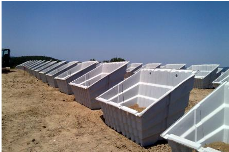
L'impianto fotovoltaico in via di realizzazione nella ex discarica delle Fornaci

Al via i lavori per un impianto fotovoltaico di 200 kWp