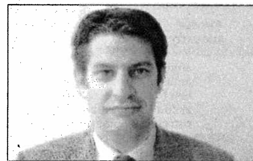
ANALISI DI ASSINDUSTRIA «Servono innovazione e infrastrutture»