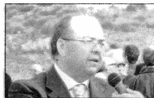
ENERGIA DAL VENTO Il business da record di Moncada Energy